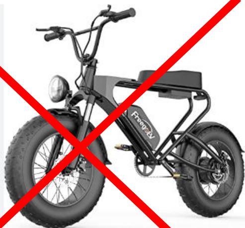
Kampe Fat Bike bicicletta elettrica con acceleratore e pedalata assistita