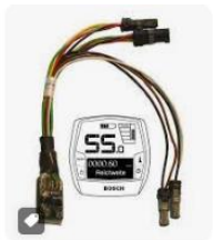
Bikeshopping Vendita ASA Tuning s...

che aumenta la velocità massima, ma mette a rischio la sicurezza, la salute e la “tenuta” della bicicletta.