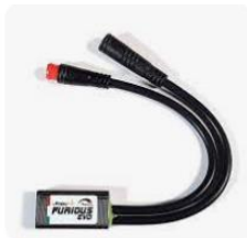
SPEEDFUN SpeedFun tuning ebike sb...